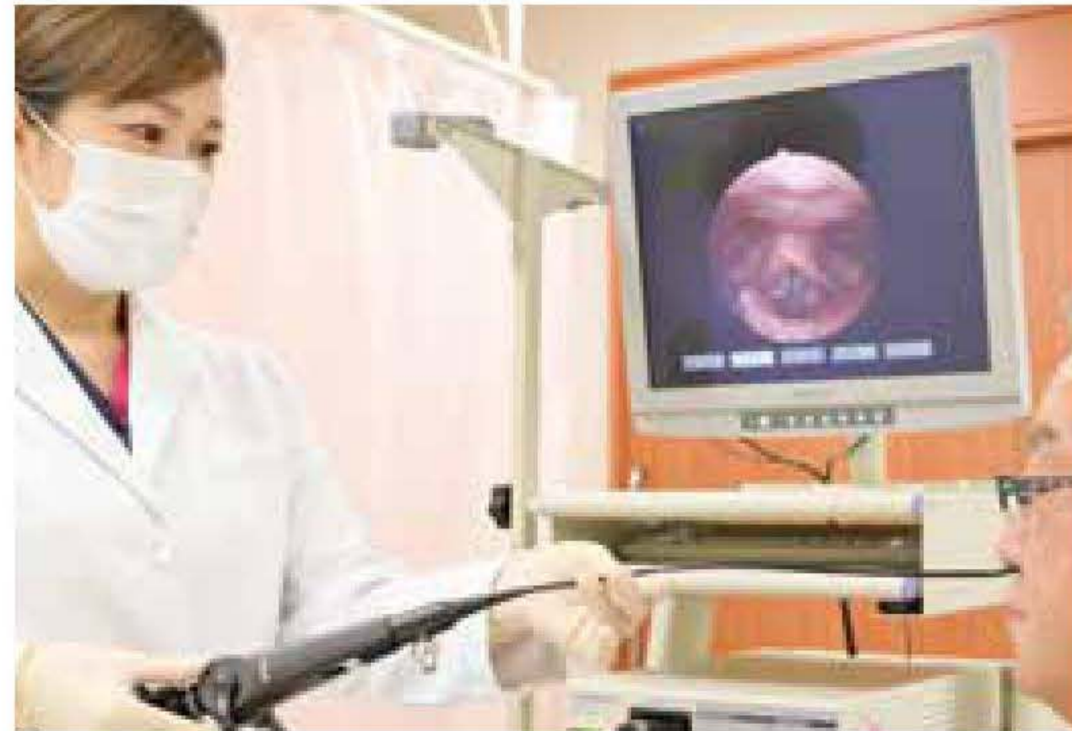
摂食嚥下障害検査