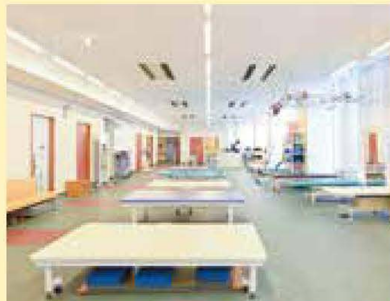
リハビリテーション室