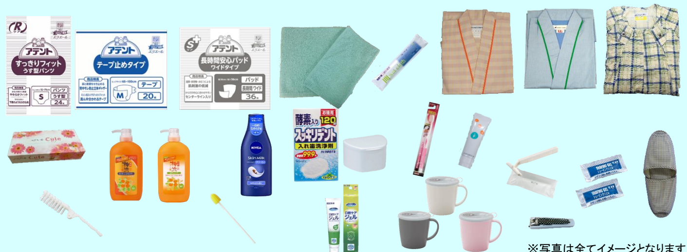
※写真は全てイメージとなります